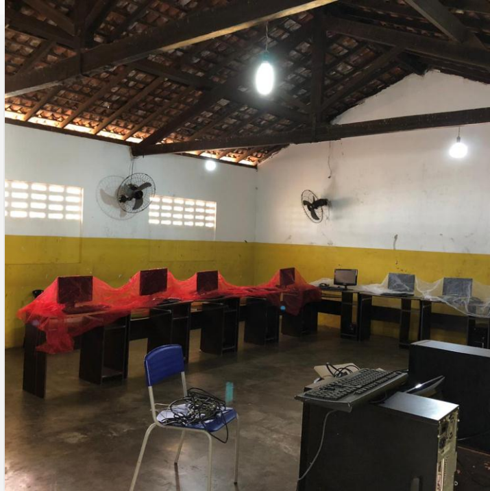
Sala de Aula – Substituir Cobogós por Janelas em Alumínio, Trocar Piso, Revestir Paredes com Cerâmica até 1m e forrar.