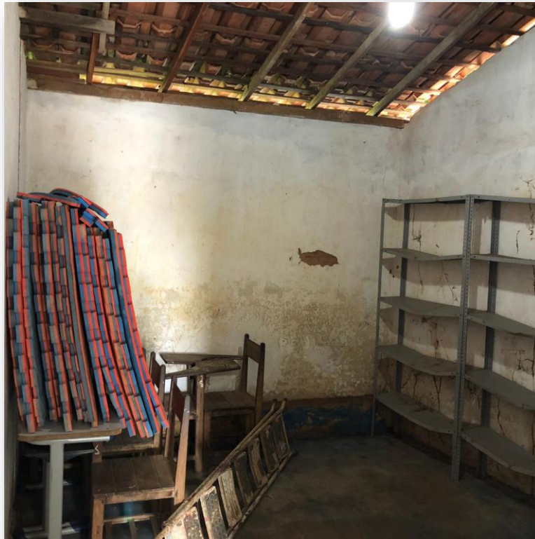
Revestimento / Piso / Teto a Recuperar