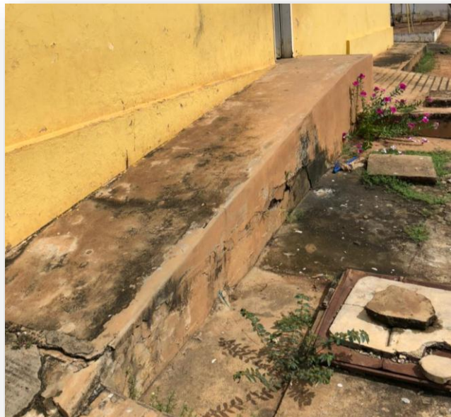
Rampa a recuperar e incluir guarda corpo.