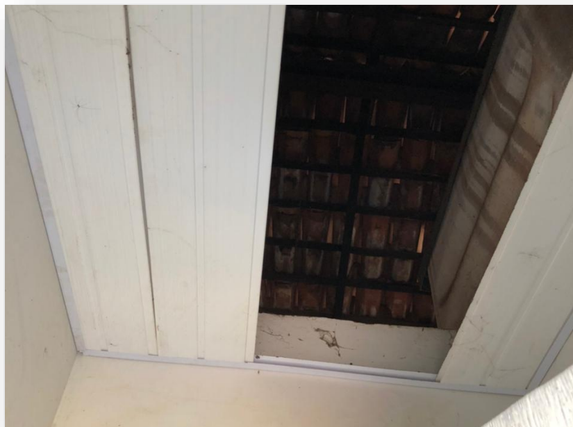
Forro PVC danificado.