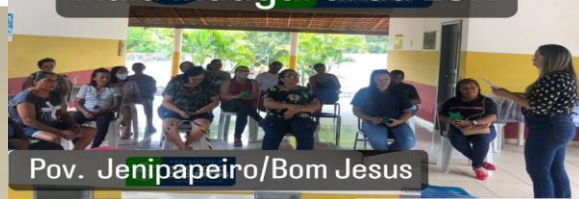
Pov. Jenipapeiro/Bom Jesus