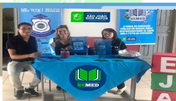
Aula Inaugural da EJA