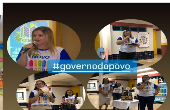
Encerrando a noite participando do Encontro Formativo do Programa Volta ao Novo