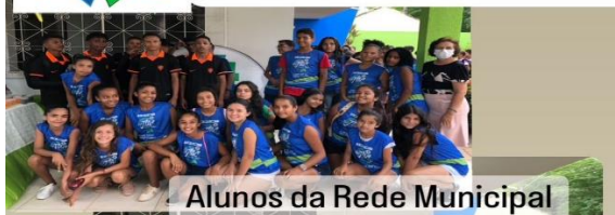
Alunos da Rede Municipal