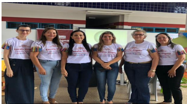
Ciclo Formativo Municipal I MÓDULO FORMATIVO 2022 Eixo Educação Infantil